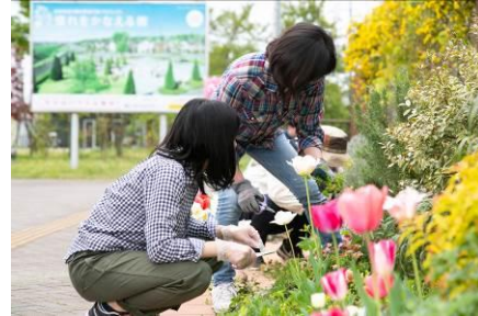
△地域住民主体の駅前・ソライエひろば・シェア畑でのガーデニング活動