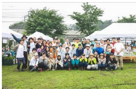
△地域住民主体のファーマーズマーケット 野田市魅力発信事業(2019年)