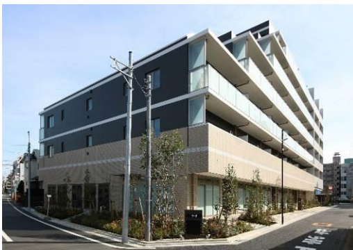
△子育て支援施設併設賃貸マンション ソライエアイル練馬北町（外観）

当社沿線により多くの方々にお住まいいただくため、お客様の価値観やライフステージの変化に合わせて、「ソライエ」シリーズをはじめとした賃貸・分譲住宅開発を進めております。