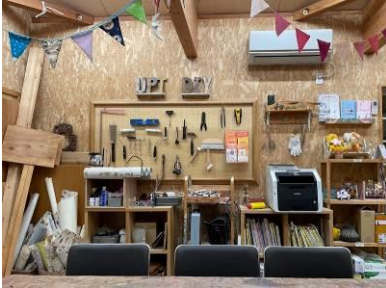
△ものづくりの工房での準日用品(草刈り機や工具等)のシェアリング

「ソライエひろば」では、誰でも使える施設(キッズスペースやえほんの図書館等を備えた「販売センター」、ものづくりの工房、ピザ窯等)を設置し、地域住民主体のコミュニティ形成イベントやシェアリングエコノミーが広がっています。