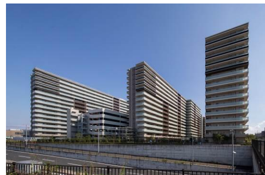
△分譲マンション ソライエグラン流山おおたかの森（外観）

■ソライエ公式HP https://www.solaie.jp/top.html