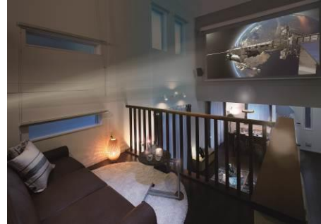
△1つ1つ間取りが異なる「for ONES」の住宅