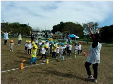
△「しみず空と杜の保育園」運動会(2022年)