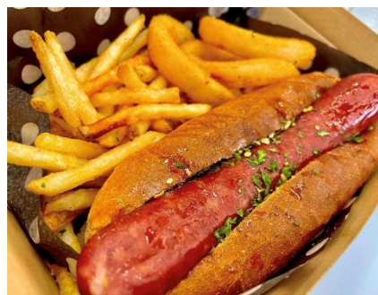
△出店予定のご当地グルメ、産直野菜