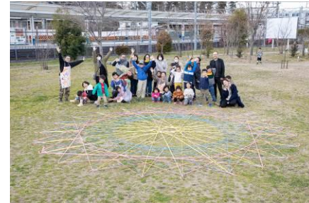
△地域住民主体のワークショップ(2020年)