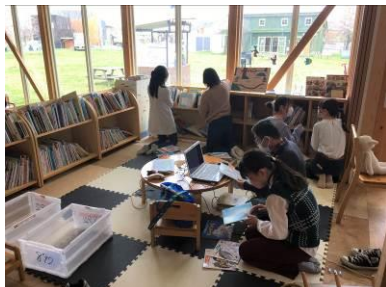
△「えほんの図書館」での寄贈本回収のボランティア活動(2022年)