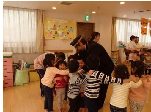
△保育施設でのイベントの様子