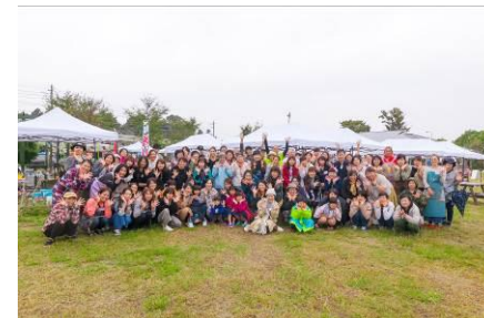
△地域住民主体のマルシェ(2019年)