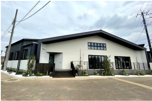
△しみず空と杜の保育園

働く子育て世代を支援するため、沿線の当社保有地に保育施設・学童保育室の誘致を進めています。2022年4月には東武アーバンパークライン 清水公園駅前に認可保育所「しみず空と杜の保育園」を開設し、駅チカ保育所は合計18施設、学童保育室は合計2施設となりました。