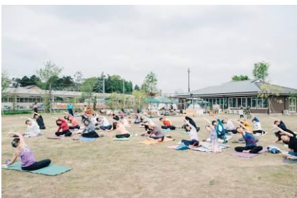
△地域住民主体のソトヨガ(2015年)